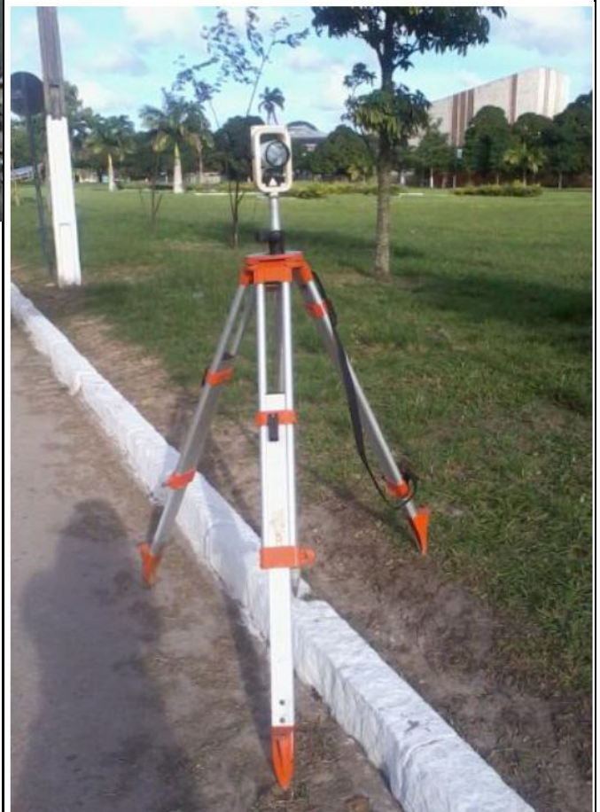
Vértice L2 ocupado com tripé e bastão e prisma. Foto: Janeiro 2014, (SILVA, 2014).