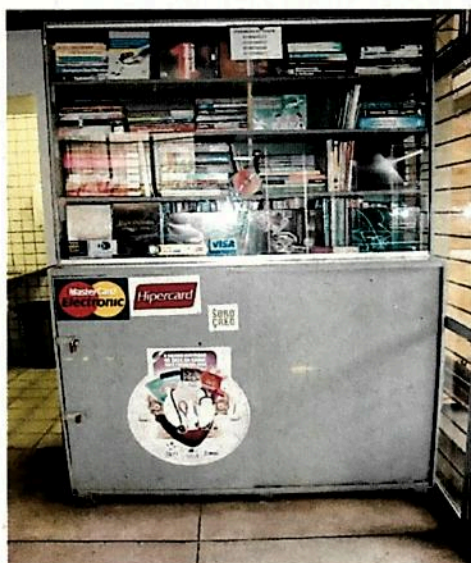
VISTA FRONTAL ESTANTE ASPECTO: BOM