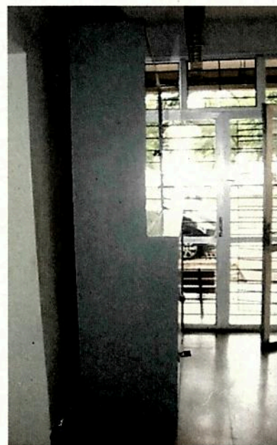
VISTA LATERAL ESTANTE ASPECTO: BOM