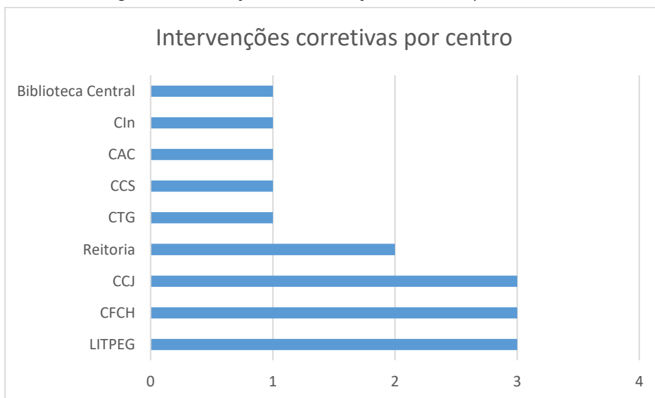
Figura 3- Distribuição das intervenções corretivas por centro da UFPE

Está representada no gráfico abaixo a distribuição, por centro da UFPE, do total de intervenções de manutenções corretivas registradas no período. Os centros que não aparecem no gráfico não tiveram intervenções corretivas registradas.