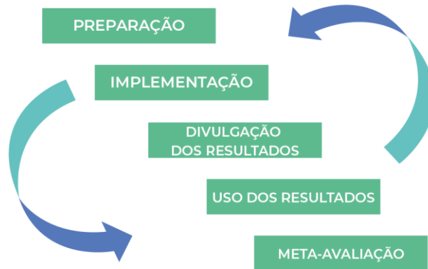
Figura 1 - Pasos de autoevaluación

La propuesta de autoevaluación, como proceso, consta de cinco etapas, como se muestra en la figura 1.