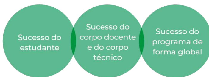
Figura 3 - Dimensiones presentes en el proceso de autoevaluación

La UFPE (2020) recomienda que los instrumentos de evaluación incluyan tres dimensiones principales (Figura 3): el éxito del alumno, el personal docente y técnico y el éxito del programa de manera global.