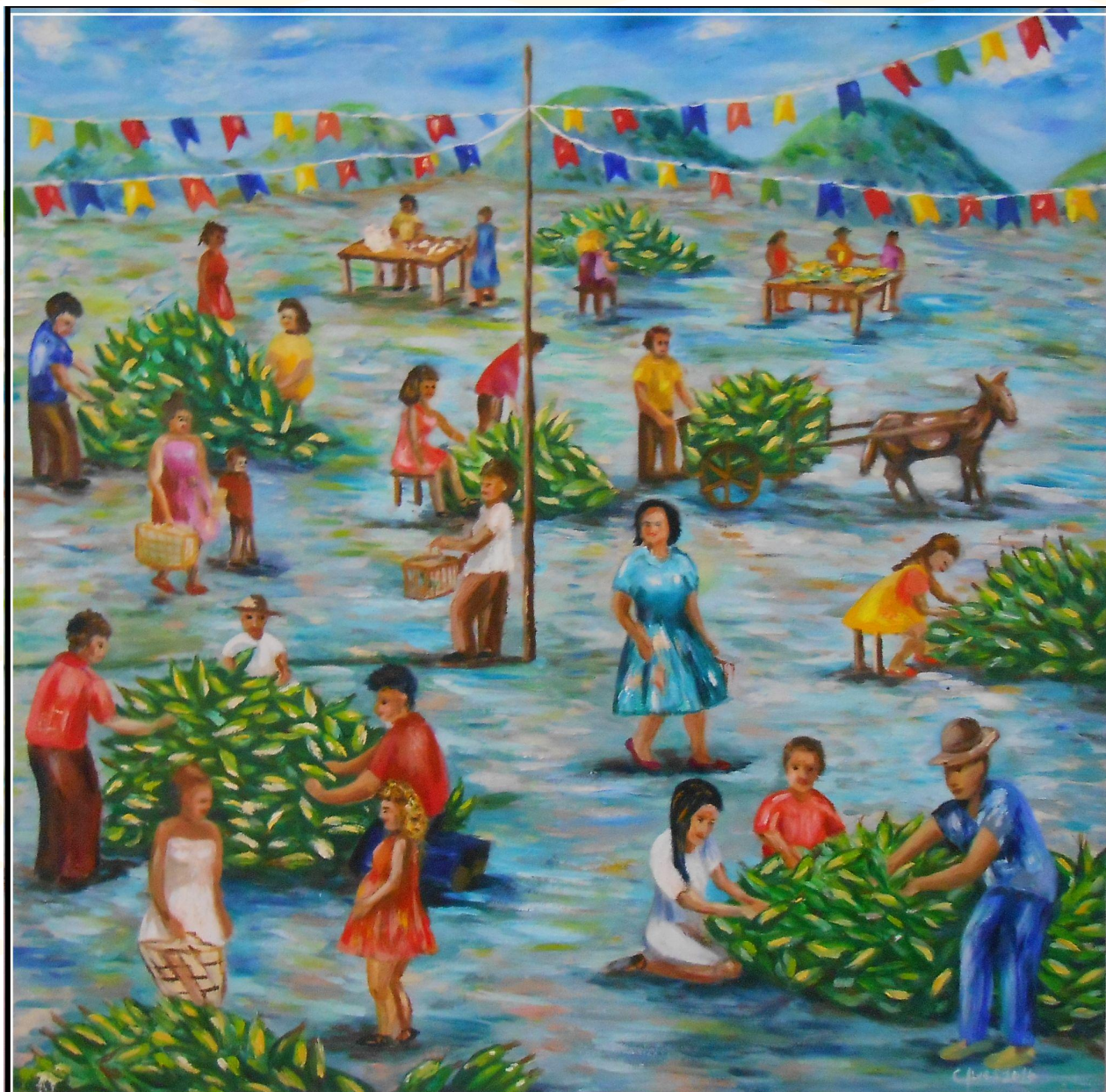
Obra: Feira de Milho Autor(a): Claudia Alves de Oliveira