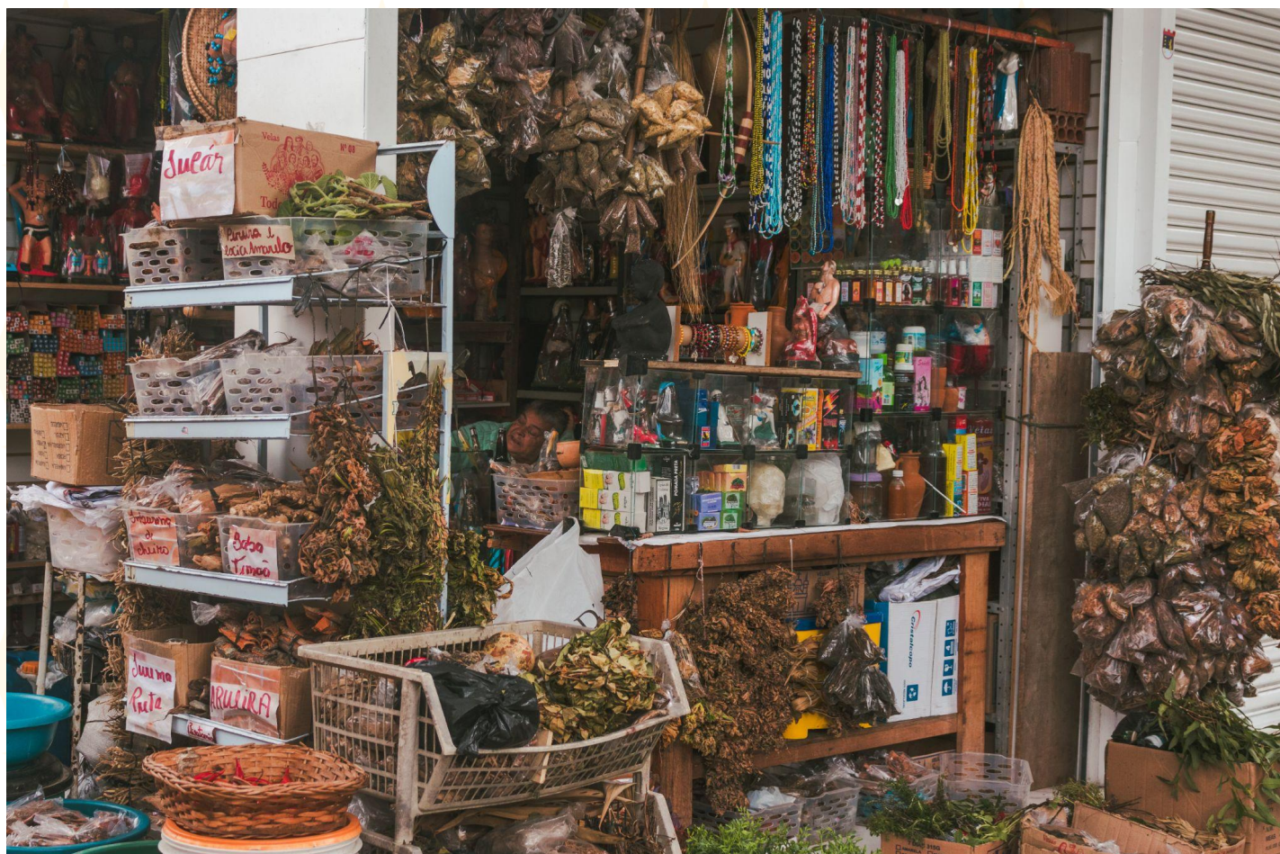
Obra: Cura de Raízes Autor(a): Daniele Cristina