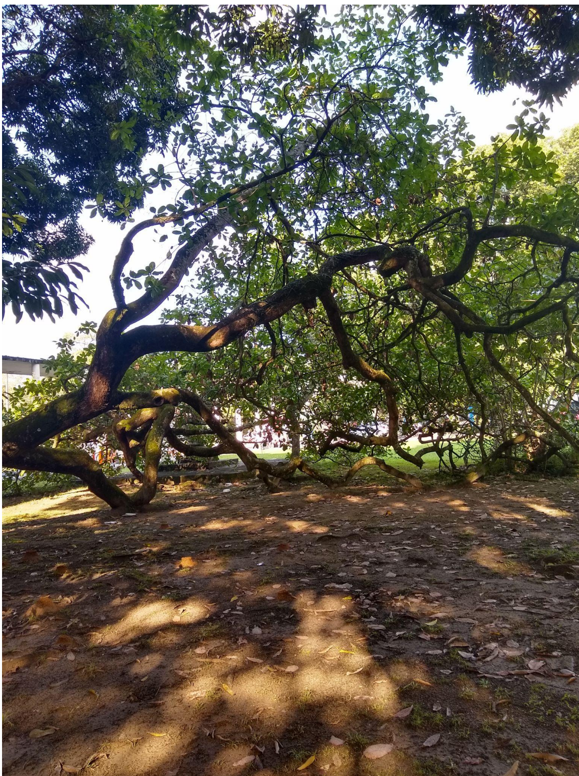
Obra: Cajueiro da UFPE Autor(a): Jorge Mário