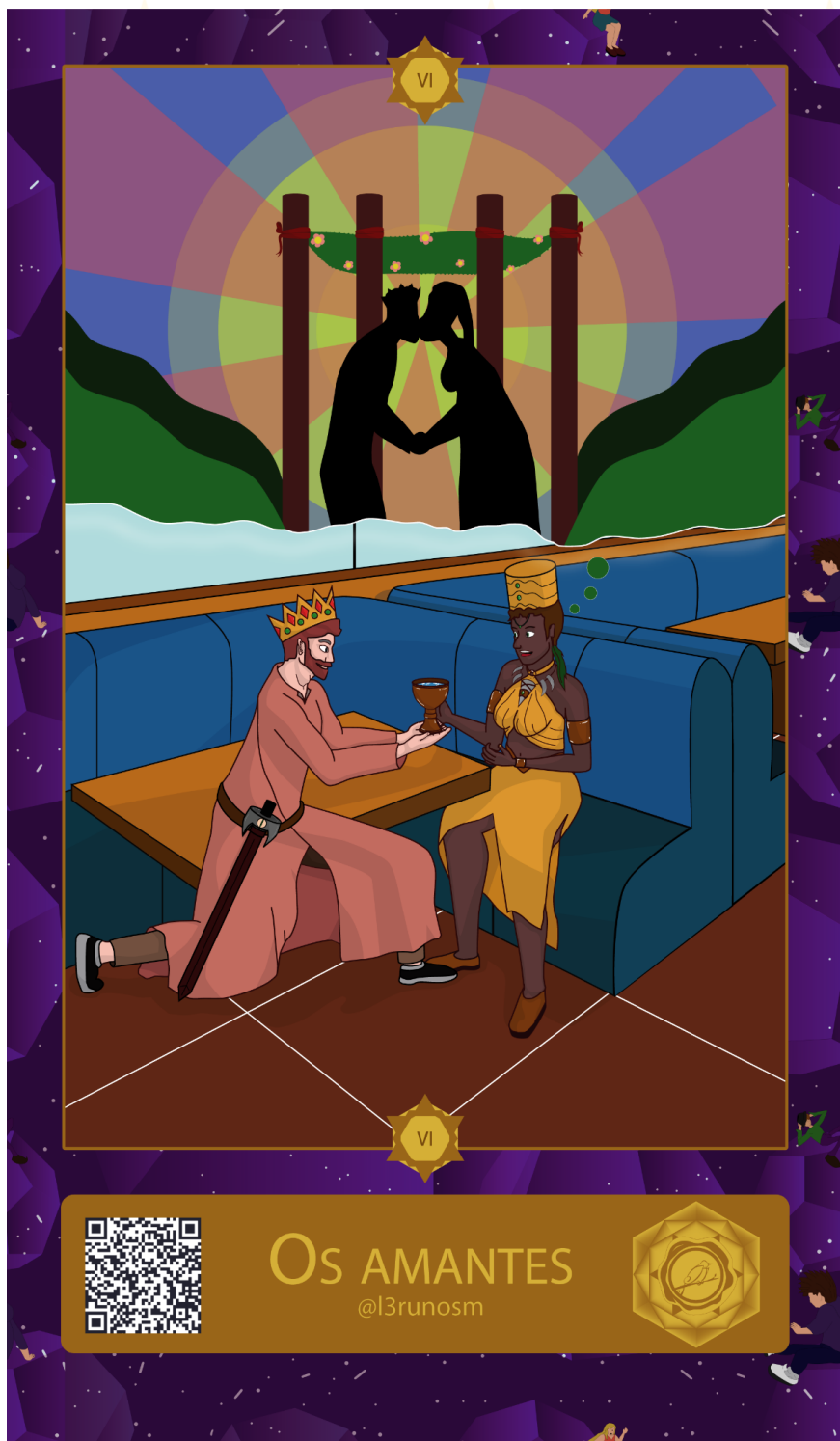
Obra: Os Amantes Autor(a): Bruno Silva