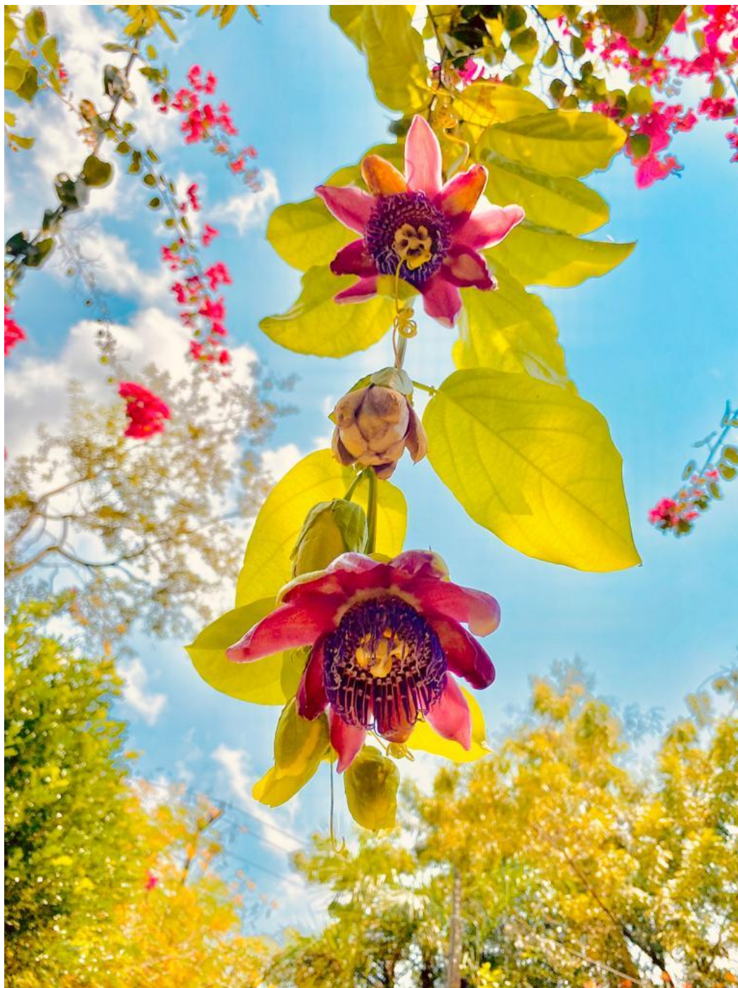
Obra: Flores de Maracujá Açú Autor(a): Fabiana Maria