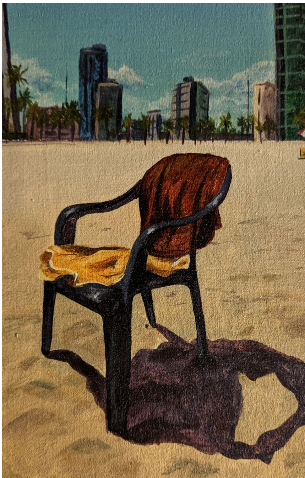
Obra: Ausência Autor(a): Igor Gustavo