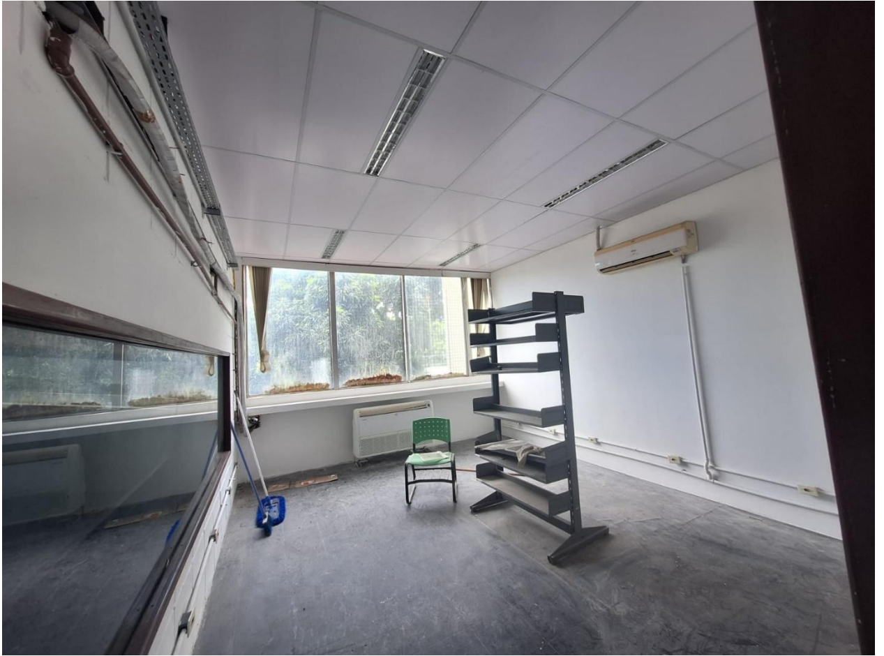
Forro do ateliê 04 concluído.