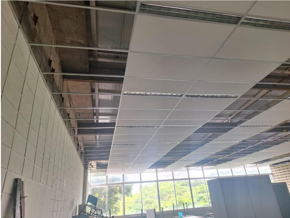
Todos os forros das salas dos ateliês concluídos