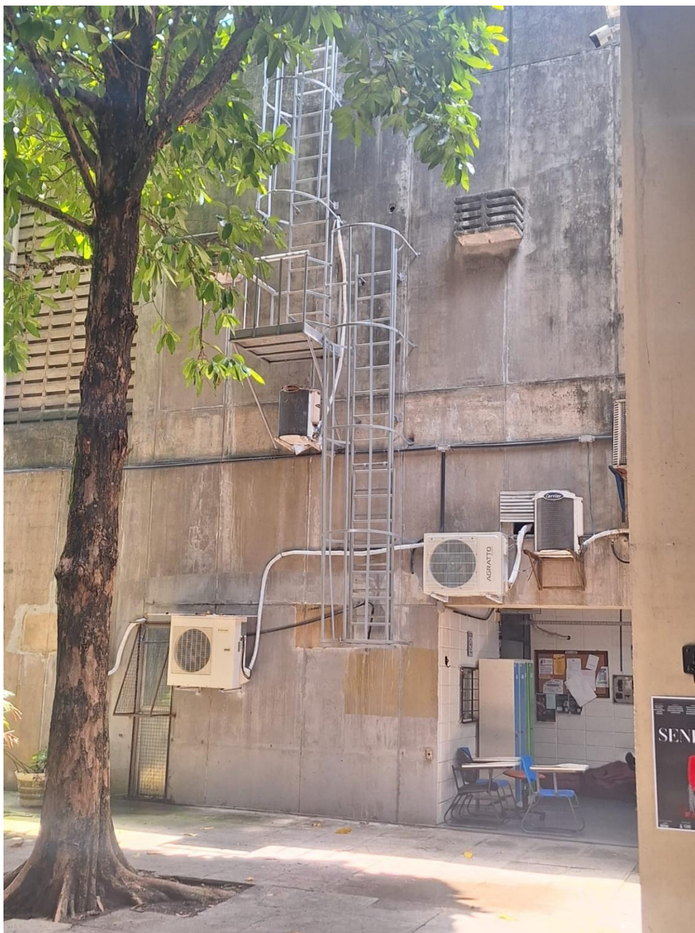
Escada metálica de acesso à cobertura