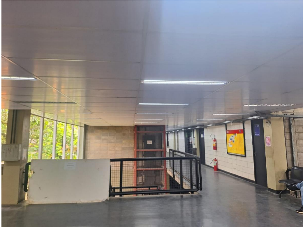
Forro do hall central concluído