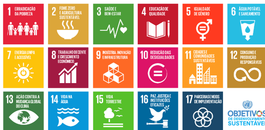
Figura 02 – 17 objetivos globais para o desenvolvimento sustentável. (Fonte: ONU, 2015).

de aprendizagem ao longo da vida que os ajudem a adquirir os conhecimentos e habilidades necessários para explorar as oportunidades e participar plenamente da sociedade” (ONU Brasil, https://nacoesunidas.org/pos2015/agenda2030/ ). São esses os objetivos globais: