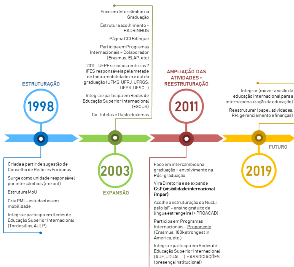
Figura 01 – Da CCI a DRI, de 1998 a 2019

A figura 01 ilustra a evolução da CCI a DRI.