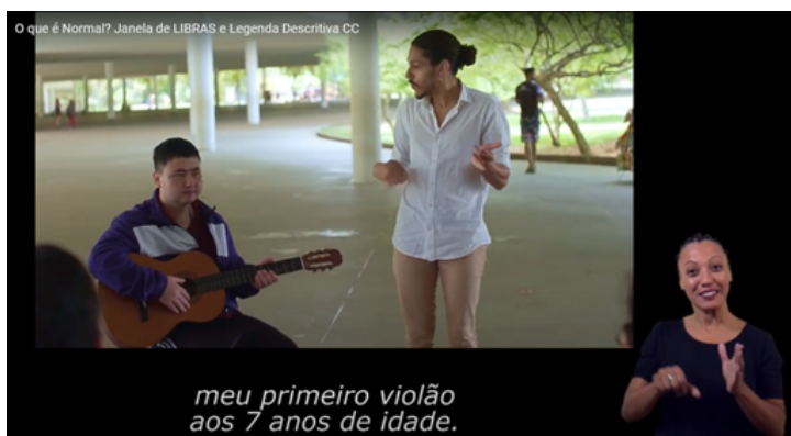
Figura 2 Exemplo de um vídeo acessível para discentes surdos ou com deficiência auditiva disponível no seguinte endereço do YouTube: https://www.youtube.com/watch?v=_Pvo-28LA7Bg ou clique na imagem para acessar o vídeo

comunidades surdas, oficialmente reconhecida a partir da Lei nº 10.436/2002 (BRASIL, 2002), que coadunam com a necessidade do discente. Nesse sentido, se faz necessário saber se o discente é usuário da Libras ou se prefere usar da Legenda em língua portuguesa. É relevante frisar que a utilização de apenas um recurso não elimina o outro, dessa forma, a sugestão é que se opte pela utilização dos dois recursos simultaneamente.