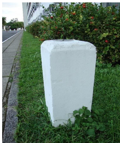
Data da foto: Maio de 2017

Monografia elaborada em (Souza, 2017) - PIBIC - Propesq / UFPE